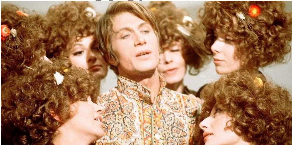
Jacques Dutronc en de meisjes

Si vous êtes comme ça, téléphonez-moi Si vous êtes comme ci, téléphonez-me Si vous êtes comme ça, téléphonez-moi Si vous êtes comme ci, téléphonez-me