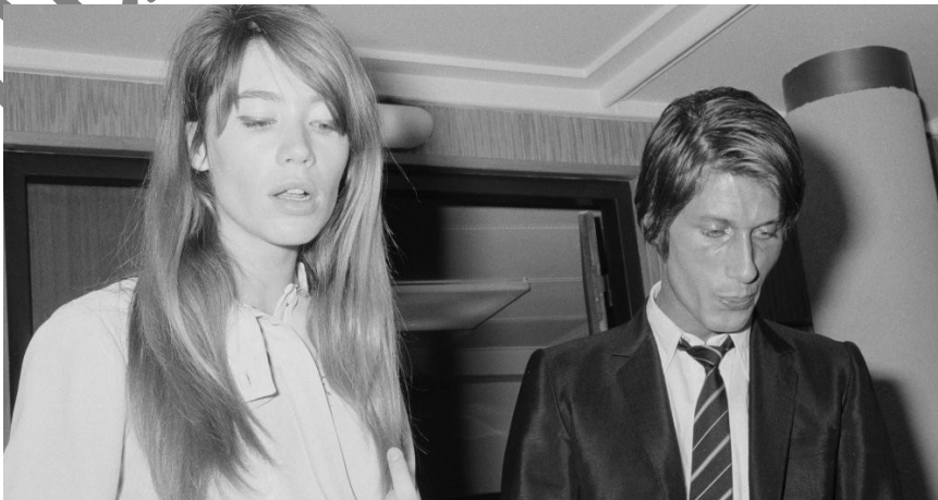
Françoise Hardy en Jacques Dutronc

J'aime les filles à dot J'aime les filles à papa J'aime les filles de Loth J'aime les filles sans papa J'aime les filles de Mégève J'aime les filles de Saint-Tropez J'aime les filles qui font la grève J'aime les filles qui vont camper